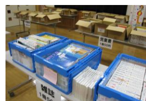
(昨年の会場の様子)