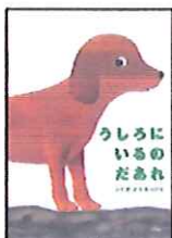
うしろにいるのだあれ accototo 作 (ふくだとしお+あきこ) 幻冬舎

読みながらお子さんとコミュニケーションできる絵本をご紹介します。ママのほうがか夢中になってしまうかも♡