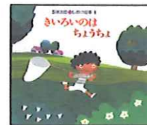
きいろいのほ ちようちよ 五味太郎作 偕成社

絵本の黄色い丸をおしてページをめくるとあれれ？不思議なことがおこります。こすったり、ゆらしたり、こんなものあり？なとって楽しい絵本です。