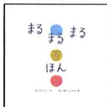
まるまるまるのほん エルヴェ・テュレ作 ポプラ社

犬さんのうしろに次々出てくる動物、わかるかな？最後の場面で「そうだったのか！」と驚かされます。